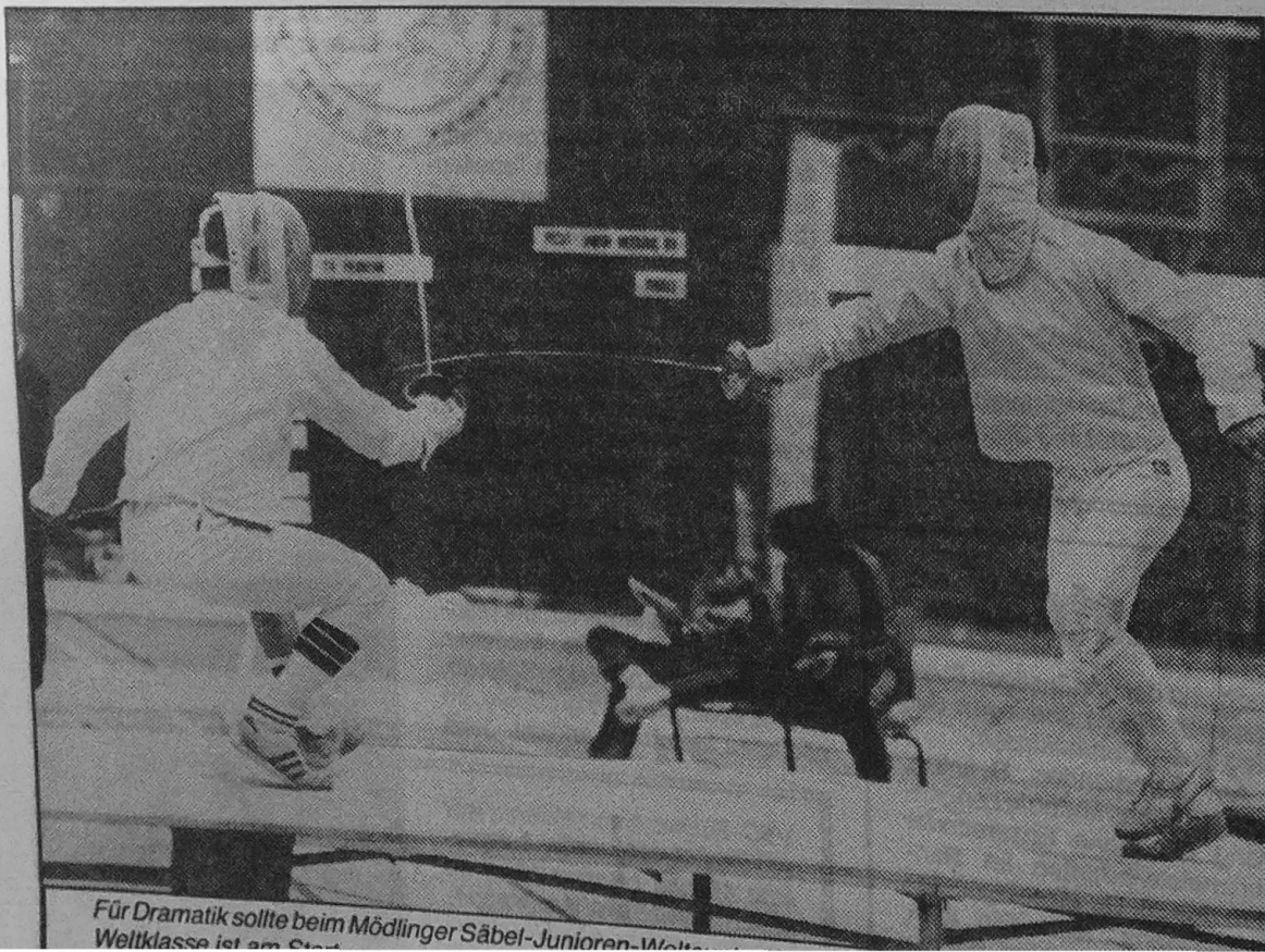
Für Dramatik sollte beim Mödliner Säbel-Junioren-Weltcupturnier...